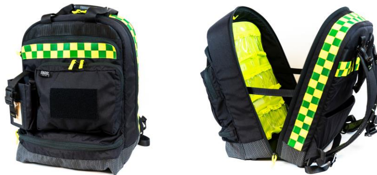
Bilder från: Sacci AB

Hej alla pedagoger som jobbar inom förskolan samt F-3 i Falun och Borlänge. Nu kommer vinterutmaningen, som går ut på att förbättra barnens egna ryggsäckar utifrån deras önskemål. Utmaningen innehåller moment av teknik, behovsstyrning, innovation och design på ett enkelt och elevnära sätt.